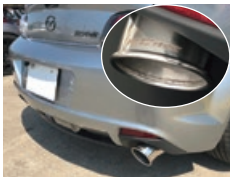
ULTIMATE-DolphinTail MUFFLER マフラー規制対応品(近接排気騒音・加速騒音) 近接のカーブとダンパーノイズ、特種部品構成タイコによる排気効率を上げながら軽やかなサウンドを生み出します。 テール上部にはRE雨宮ロゴの刻印入 MO-088035-A17 【後期】——¥183,700(税込)¥167,000(税抜) NO:EO-088035-B17 【前期】——¥183,700(税込)¥167,000(税抜)