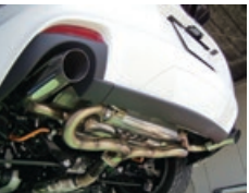
SUPER DolphinTail Muffler NO:MO-033035-006 【前期】——¥184,800(税込)¥168,000(税抜) NO:MO-033035-016 【後期】——¥196,020(税込)¥178,200(税抜)