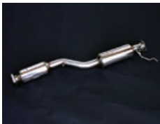
SPORTS CATALYZER 新世代メタル触媒、触媒ストリートと同等の排気効率、レスポンスを発揮するとともに静粛な走行機能、消音機能サイレンサーも備えたNEWキャタライザーです。 LA/ABA(6MT, 4AT, 6AT) 排ガス基準適合 NO:MO-082038-003 ¥144,980(税込)¥131,800(税抜)