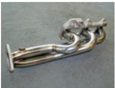
SUS Ex.MANI HOLD NO:MO-088035-002 ¥135,960(税込)¥123,600(税抜)