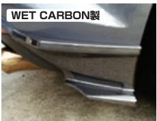
REAR SUPER CANARD [MC後専用] FRP製(未塗装品) NO:D0-088030-045 ¥45,540(税込)¥41,400(税抜) WET CARBON製 NO:D0-088030-046 ¥61,380(税込)¥55,800(税抜)