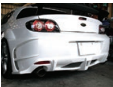
REAR BUMPER D1 FRP製(未塗装品) NO:D0-088030-055 【後期】——¥122,540(税込)¥111,400(税抜) FRP製(未塗装品) NO:D0-088030-056 【前期】——¥122,540(税込)¥111,400(税抜) *写真のセクター一部がPLATEは別売りとなります。 *リフレクターは付属致しません。後期純正品をご用意下さい。