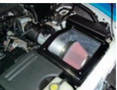
SUPER INTAKE BOX SET FRP製(未塗装品) NO:EO-088033-010 ¥84,040(税込)¥76,400(税抜) WET CARBON製 NO:EO-088033-011 ¥106,480(税込)¥96,800(税抜)