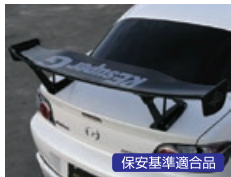
REAR SPOILER GTIII ○5段階調節式 ○アルミ製(黒アルミ)取付けステー付属 FRP製(未塗装品) NO:22080330FGT03 ¥156,200(税込)¥142,000(税抜) WET CARBON製 NO:22080330CGT03 ¥190,300(税込)¥173,000(税抜) *H: マウントタイプ ¥10,000 UP