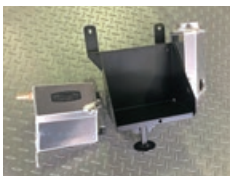
バッテリー移設キット *オイルキャッチ缶ウォッシュタンク付 NO:DI-088030-003 ¥48,180(税込)¥43,800(税抜)