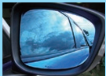
ブルーコーティング仕上げ。 ●広角視界確保 ●車検対応品 RX-8用(SE3P) NO:DI-088030-011 ¥14,080(税込)¥12,800(税抜)

RIGID COLLAR リジカラ FD3S用(FRONT) NO:FO-022032-068 — ¥26,180(税込)¥23,800(税抜) FD3S用(REAR) NO:FO-022032-070 — ¥26,180(税込)¥23,800(税抜) FC3S用(FRONT/REAR) NO:FO-012032-068 ¥29,480(税込)¥26,800(税抜) SE3P用(FRONT) NO:FO-088032-068 — ¥26,180(税込)¥23,800(税抜) SE3P用(REAR) NO:FO-088032-069 — ¥29,480(税込)¥26,800(税抜)