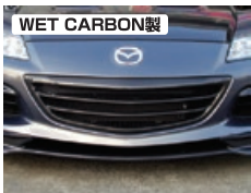
FRONT GRILLE [MC後専用] FRP製(未塗装品) NO:D0-088030-039 ¥52,140(税込)¥47,400(税抜) WET CARBON製 NO:D0-088030-040 ¥65,780(税込)¥59,800(税抜)