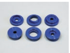
ブレドメリア RX-8のリヤメンバー(サブフレーム)は車体と6ヶ所のゴムブッシュでマウントされている為、スポーツ走行ではかなりズレが発生します。この部分の余計なズレを抑え乗り心地も改善されます。 NO:FO-088032-014 ¥22,440(税込)¥20,400(税抜)