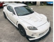
AD EIGHT FACER D1 UNDER PANEL FRP製(未塗装品) NO:D0-088030-068 ¥135,960(税込)¥123,600(税抜) WET CARBON製 NO:D0-088030-067 ¥158,400(税込)¥144,000(税抜)