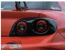
REAR LED TAIL FINISHER [MC前専用] FRP製(未塗装品) NO:D0-088030-063 ¥135,960(税込)¥123,600(税抜) WET CARBON製 NO:D0-088030-062 ¥158,620(税込)¥144,200(税抜)