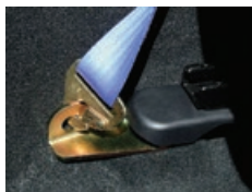
BELT ANCHOR STAY 運転席側 NO:IP-22031-091 ¥5,280(税込)¥4,800(税抜) 助手席側 NO:IP-22031-092 ¥5,280(税込)¥4,800(税抜)