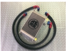
E/G OIL COOLER NO:EO-088035-004 【前期】——¥84,480(税込)¥76,800(税抜)