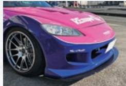
AD EIGHT FACER Ver-R For RX-8[後期] FRP製(未塗装品) NO:D0-088030-073 ¥154,000(税込)¥140,000(税抜)