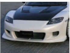
AD EIGHT FACER Ver.2 [MC前専用] FRP製(未塗装品) NO:D0-088030-002 ¥99,880(税込)¥90,800(税抜)