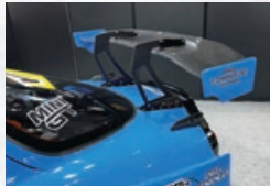
GT-WING SWAN NECK CF For RX-7[FD3S] WET CARBON製 NO:22080220CGTSW ¥418,000(税込)¥380,000(税抜)