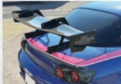
GT-WING SWAN NECK CF For RX-8[SE3P] WET CARBON製 NO:22080330CGTSW ¥396,000(税込)¥360,000(税抜)