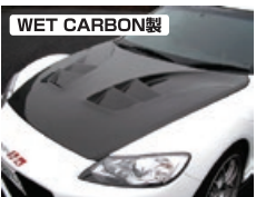
AD HOOD D1 BONNET FRP製(未塗装品) NO:D0-088030-049 ¥113,300(税込)¥103,000(税抜) WET CARBON製 NO:D0-088030-048 ¥165,440(税込)¥150,400(税抜)