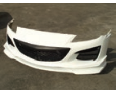
AD FACER EVO [MC前専用] FRP製(未塗装品) NO:D0-088030-047 ¥105,380(税込)¥95,800(税抜)