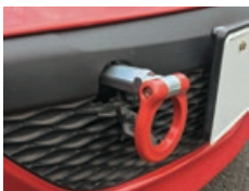
FRONT TRACTION HOOK RACING NO:DI-088030-014 ¥15,180(税込)¥13,800(税抜) FOR FACER NO:DI-088030-015 ¥15,180(税込)¥13,800(税抜)