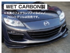
FRONT SKIRT [MC後 RS専用] FRP製(未塗装品) NO:D0-088030-043 ¥70,180(税込)¥63,800(税抜) WET CARBON製 NO:D0-088030-044 ¥95,260(税込)¥86,600(税抜)