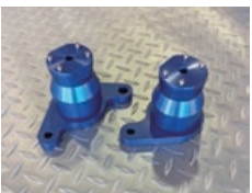
NEW ALUMI ENGINE RIGID MOUNT NO:EO-088035-N18 ¥45,320(税込)¥41,200(税抜)