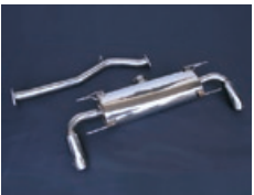
Dolphin Tail Muffler NO:MO-088035-001 【前期】——¥124,740(税込)¥113,400(税抜) NO:MO-088035-011 【後期】——¥124,740(税込)¥113,400(税抜)