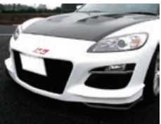
AD EIGHT FACER D1 FOG FRP製(未塗装品) NO:D0-088030-D50 【後期】——¥99,880(税込)¥90,800(税抜) FRP製(未塗装品) NO:D0-088030-D60 【前期】——¥99,880(税込)¥90,800(税抜)