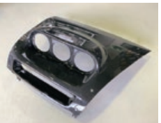
3連METER PANEL FRP製(未塗装品) NO:D0-088030-002 ¥33,880(税込)¥30,800(税抜) WET CARBON製 NO:D0-088030-001 ¥41,800(税込)¥38,000(税抜)