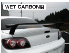
AD REAR WING RS FRP製(未塗装品) NO:D0-088030-054 ¥93,060(税込)¥84,600(税抜) WET CARBON製 NO:D0-088030-053 ¥119,900(税込)¥109,000(税抜) *リヤトランクがない、またはタイプがRS以外は穴開けが必要になりますのでご確認ください。