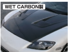
AD HOOD EIGHT FRP製(未塗装品) NO:D0-088030-009 ¥113,300(税込)¥103,000(税抜) WET CARBON製 NO:D0-088030-008 ¥165,440(税込)¥150,400(税抜)