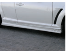
AD SIDE STEP FRP製(未塗装品) NO:D0-088030-003 ¥86,240(税込)¥78,400(税抜)